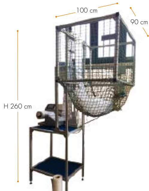
Sistema distribuzione automatico. Automatic delivery system.