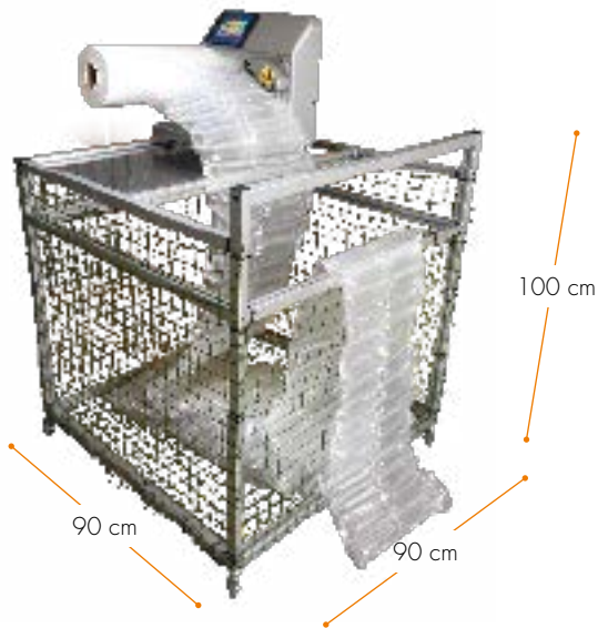
Cesto per raccolta cuscini con fotocellula pieno vuoto. Bin to collect cushions with automatic start and stop.