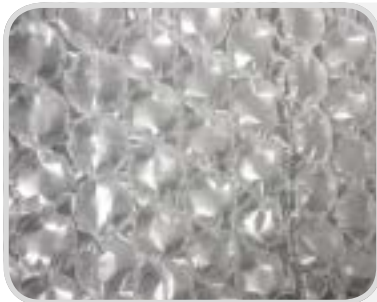
Bubble big perf. 300