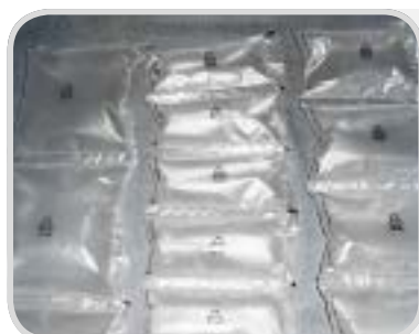
Cushions width 200 mm Perf. 100 Perf. 140 Perf. 200