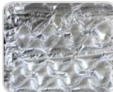
Quilt large perf. 160