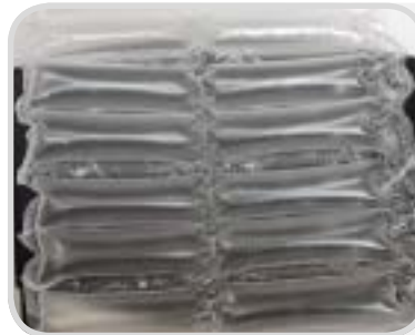
Tube small perf. 200