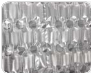
4 cushions perf. 200